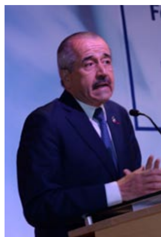
José Ángel Córdova Villalobos.